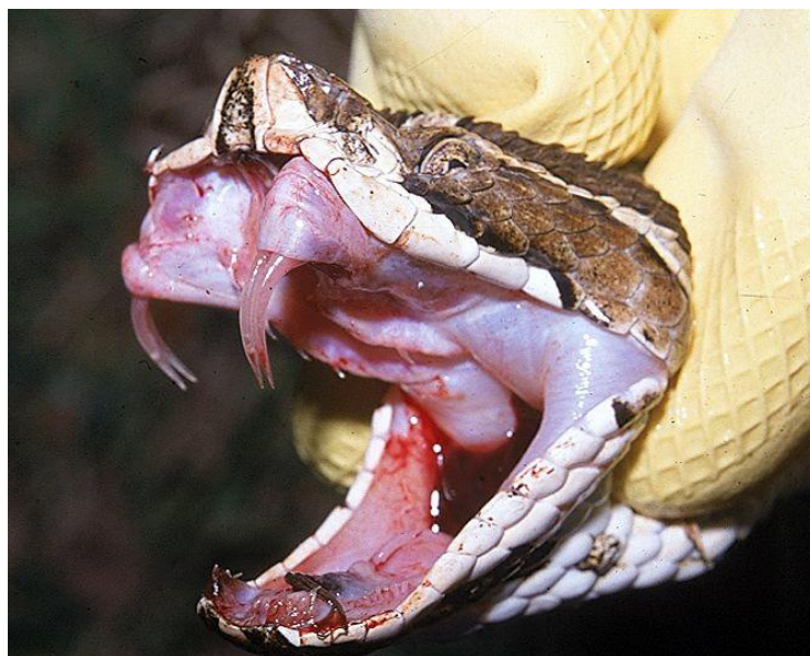
Detalle de los colmillos (dos de cada lado en este caso) de una Yará Grande o Víbora de la Cruz ( Bothrops alternatus ). Se nota cerca del extremo el orificio por el que inocular el veneno.

Referencias importantes: d: glándula de Duvernoy, e: glánd. supralabial h: glándula de veneno, i: esmalte, k: dentina, l: cavidad de la pulpa, m: canal del veneno, n: maxilar, o: Prefrontal, p: frontal, parietal y escamoso, q: cuadrado, r: pterigoides, s: ectopterigoides.